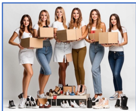
Рисунки выполнены с помощью нейросетей ( https://rudalle.ru , https://hand-text.ru ).

7 студенток Пензенского филиала Финуниверситета решили купить новую обувь. В какой последовательности им нужно оплачивать покупки, чтобы получить максимальную выгоду?