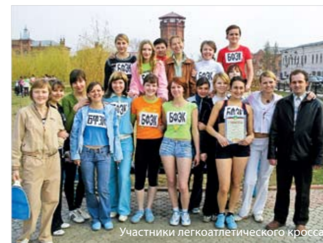
Участники легкоатлетического кросса