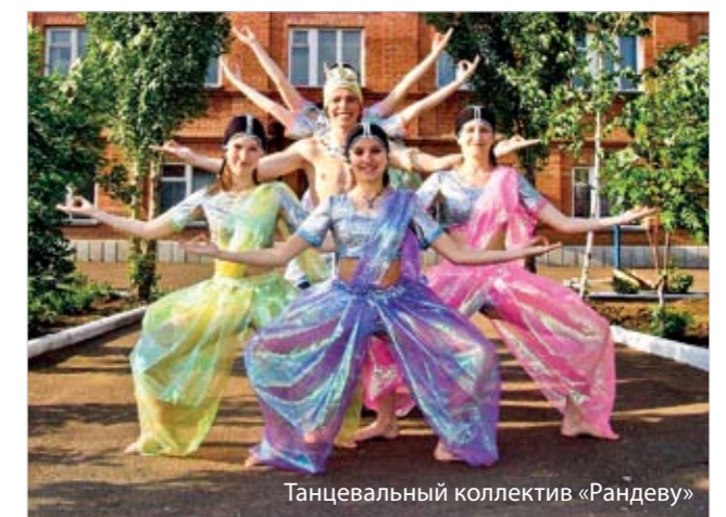
Танцевальный коллектив «Рандеву»