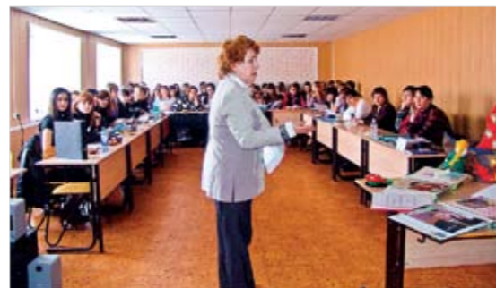
IX научно-практическая конференция СНО БФЭК. Заседание секции

кой атлетики. Увлекаются студенты аэробикой, брейк-дансом, атлетической гимнастикой, армрестлингом, шашками и шахматами, боксом и борьбой,