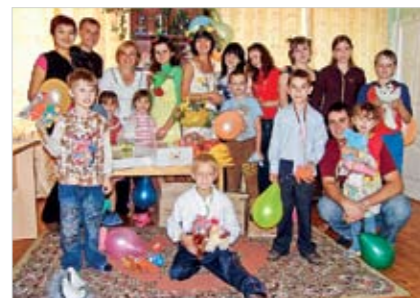
Волонтеры БФЭК в социальном приюте г.Бузулук.