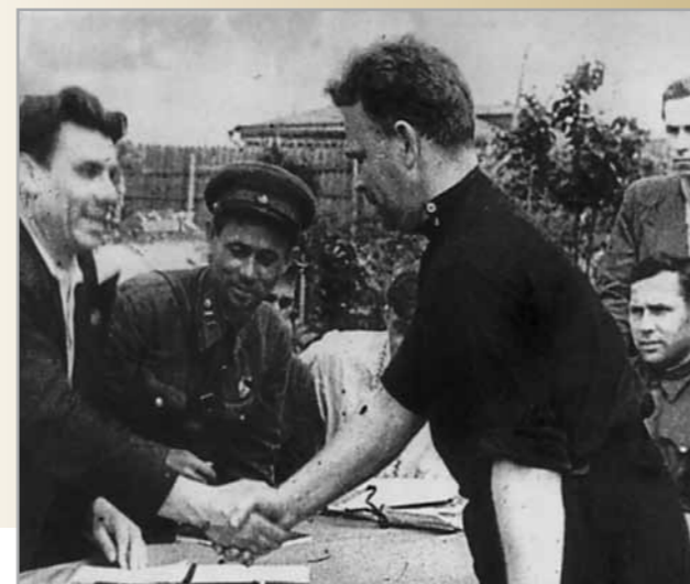
Запись в ополчение