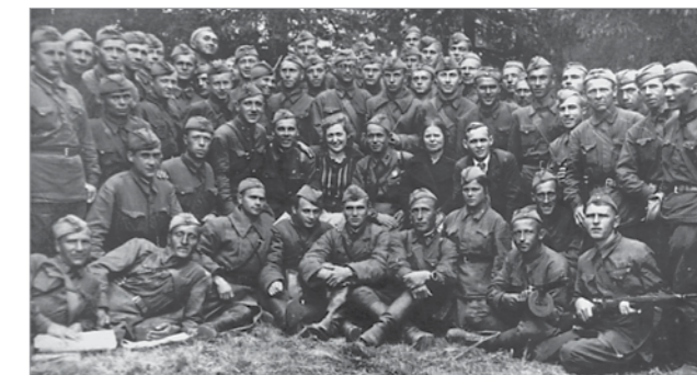
Бойцы 13 ДНО на фронте

Добровольцами в ополчение записывались те, кто по каким-то параметрам не был годен к строевой службе. История сохранила некоторые фамилии добровольцев –