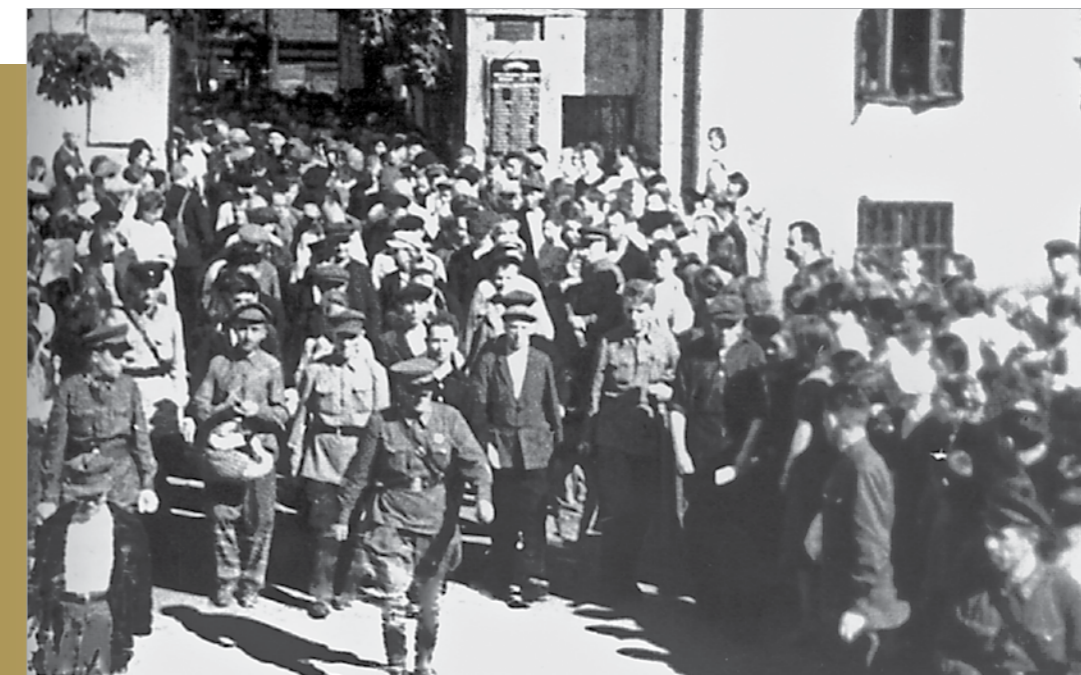
Ополченцы 13 ДНО идут по 1-й Мещанской улице (ныне проспект Мира) на сборные пункты, 6 июля 1941 г.