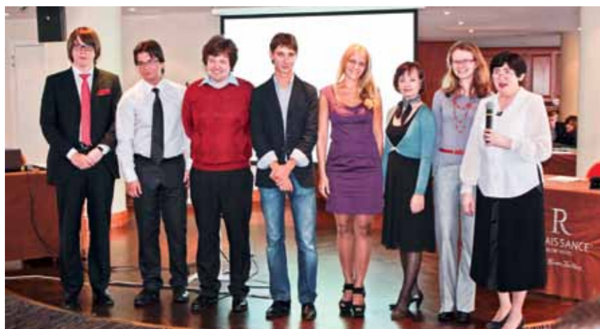
Студенты Международных Программ ЛУ третьего года обучения (поступившие в 2009 году), – наши следующие выпускники