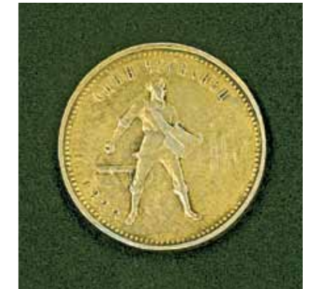
Червонец РСФСР. 1923 г. Золото. Диаметр 22 мм

• во-первых, эти меры регулировали денежное обращение (максимальное ограничение бюджетного дефицита, сжатие банкнотной эмиссии и др.);