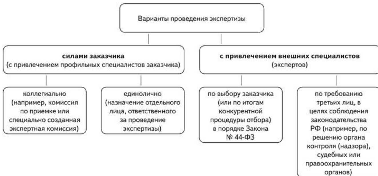
Схема 1. Как организовать экспертизу

В конкурентных закупках заказчик не обязан, но вправе привлекать сторонних специалистов. «Внешняя» экспертиза в них будет актуальной, например, если у заказчика нет практического опыта в приемке или нет специалистов, которые способны оценить качество поставленных товаров, оказанных услуг, выполненных работ. Наглядно показали, как организовать экспертизу, на схеме 1.