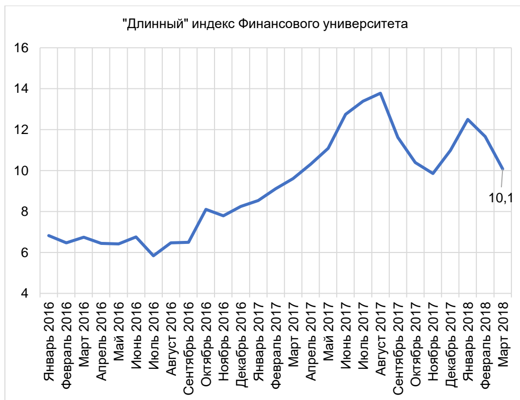
Рисунок 2. «Длинный» индекс Финансового университета при Правительстве РФ в 2016-2018 годах