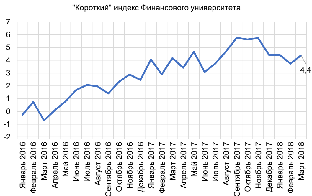
Рисунок 1. «Короткий» индекс Финансового университета при Правительстве РФ в 2016-2018 годах