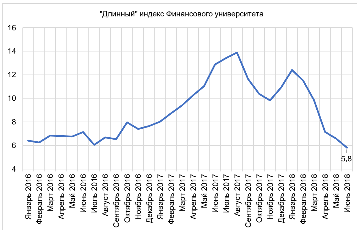
Рисунок 2. «Длинный» индекс Финансового университета при Правительстве РФ в 2016-2018 годах