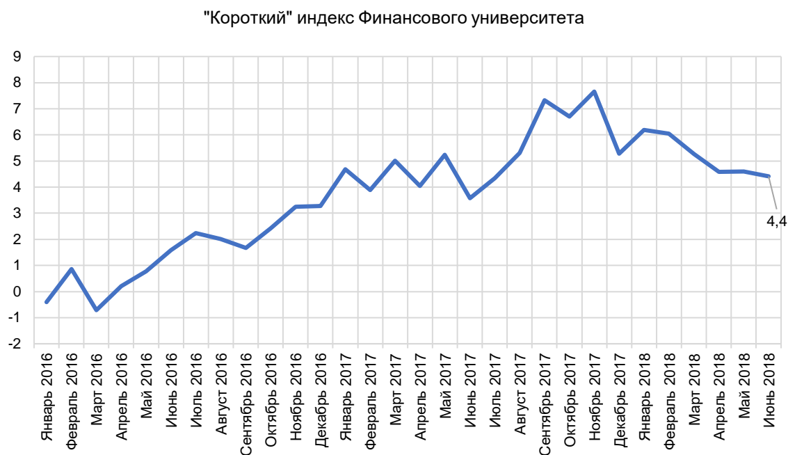
Рисунок 1. «Короткий» индекс Финансового университета при Правительстве РФ в 2016-2018 годах