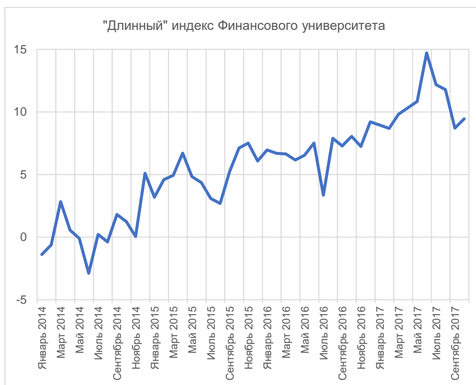
Рисунок 2. «Длинный» индекс Финансового университета при Правительстве РФ в 2014-2017 годах