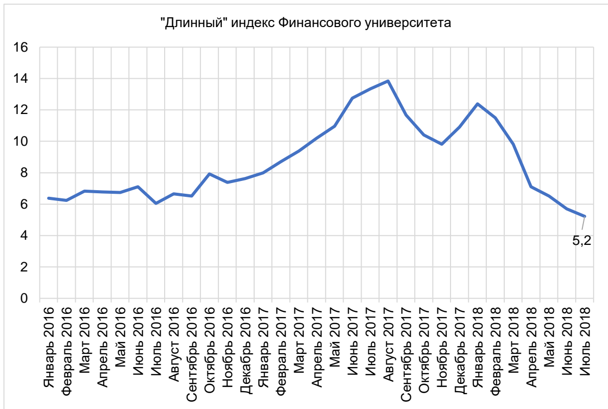
Рисунок 1. «Длинный» индекс Финансового университета по итогам исследований за июль 2018 г.